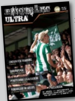
»BLICKFANG ULTRA`19« 3,50€