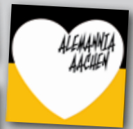
»NEUE AUFKLEBER PAKETE« 45 STK. PRO PAKET - 2,50€