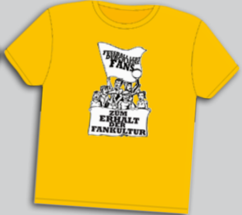
»ZUM ERHALT DER FANKULTUR« T-SHIRT S-XXL 5€