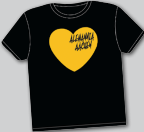
»HERZ« T-SHIRT S-XXL 10€